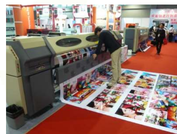
Paper Printing service