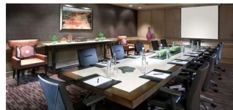
Meeting and seminar